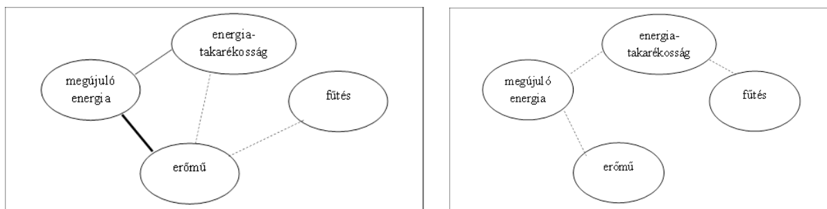
1. ábra. A kulcsfogalmak kapcsolati rendszere nagyvárosi (bal) és községi (jobb) tanulók esetében

A fogalmak összekapcsolódása, struktúrája eltérő volt, pl. lakóhely szerint; a városlakó gyerekek fejében a kulcsfogalmak komplexebb és erősebb kapcsolatokkal rendelkező rendszert alkotnak (1. ábra). A választott fogalmak egy része, pl. a fűtés gyengén rögzültek a tanulóknál, ismereteik felületesek és jellemzően nem az iskolai tananyagból, hanem a hétköznapokból származnak. Az iskolás életkorban tehát – hasonlóan az alacsonyabb végzettségű felnőtt lakossághoz – az iskolai tanulmányoknál erősebb a közvetlen tapasztalati hatás.